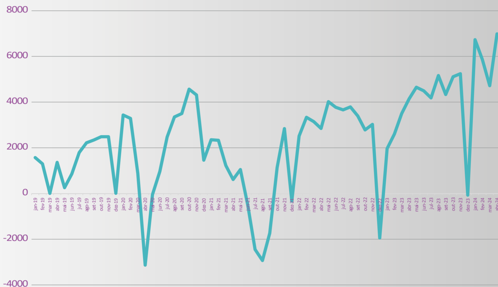
Postos de trabalhos criados para imigrantes no mercado de trabalho formal, por mês, - Brasil, 2019/2024