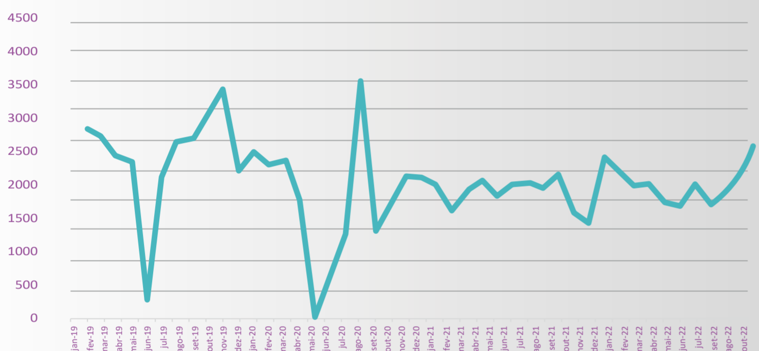
Número de autorizações de trabalho para fins laborais e de investimentos, por mês de registro - Brasil, 2019-2022.

“PELO QUARTO MÊS CONSECUTIVO AS AUTORIZAÇÕES DE RESIDÊNCIA PARA FINS LABORAIS E DE INVESTIMENTOS REGISTRARAM EVOLUÇÃO POSITIVA - 2.871 AUTORIZAÇÕES”